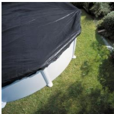
Winterabdeckung Winter cover CIPR451