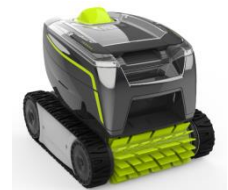
Roboter Robot GT2120 / GT3220