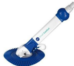
Automatischer Bodenreiniger Automatic cleaner AR20682