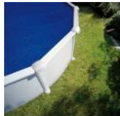
Isothermabdeckplane Isothermic cover CV450