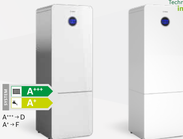
Bosch Compress 7001i LWM Bosch Compress 7001i LWMF