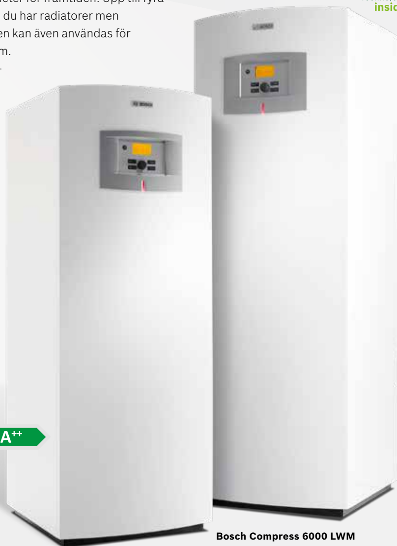
Bosch Compress 6000 LW